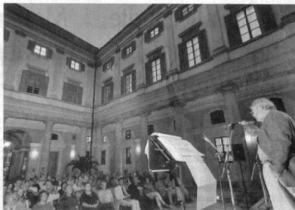
Un incontro di Poestate a Lugano.

le. Isella ha avanzato l'auspicio che questa manifestazione possa diventare una «pietra sulla quale costruire a Lugano una "casa della letteratura"», quindi estesa ad altri generi, narrativa, saggistica... Fedele ad una linea transfrontaliera (del 2007 era l'incontro su lingua e dialetto, intitolato "Dal Po al Gottardo"), Isella propone anche, in gemellaggio con la Primavera Poetica di Verbania, un omaggio a Giovanni Ramella Bagneri, un irregolare, non solo di "frontiera", ma anche di "fronte", essendo di Orcesco, in Val Vigezzo (sotto la sua finestra passava il trenino per la Svizzera). Morto l'anno scorso, ha avuto un momento di gloria quando è stato pubblicato dallo Specchio mondadoriano, ma poi altrettanto in fretta è stato dimenticato. Sarà ricordato da Tiziano Salari, oltre che dallo stesso Isella. Mentre l'attore Claudio Moneta leggerà frammenti dalla ballata del Titanic, l'ultima sua composizione pubblicata (dalla rivista ticinese "Bloc Notes"). Ospiti di prestigio saranno il versatile scrittore cubano Pablo Armando Fernandez e lo spagnolo Fernando Arrabal. Citta-